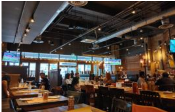
Scaddabush Italian Kitchen & Bar Front Street