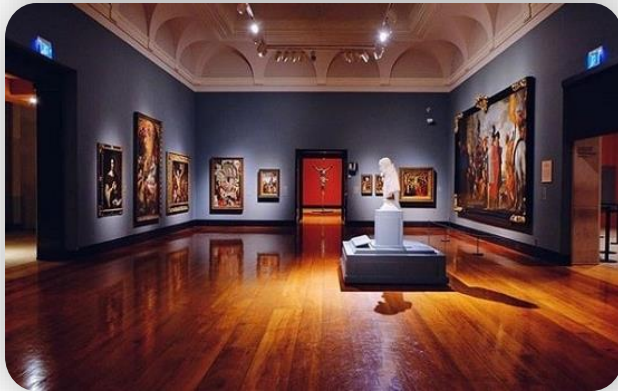
Art Gallery of Ontario