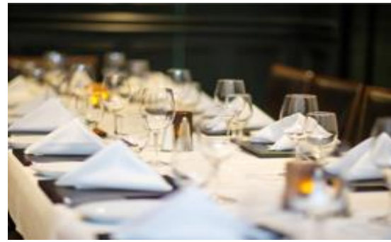
Ruth's Chris Steak House