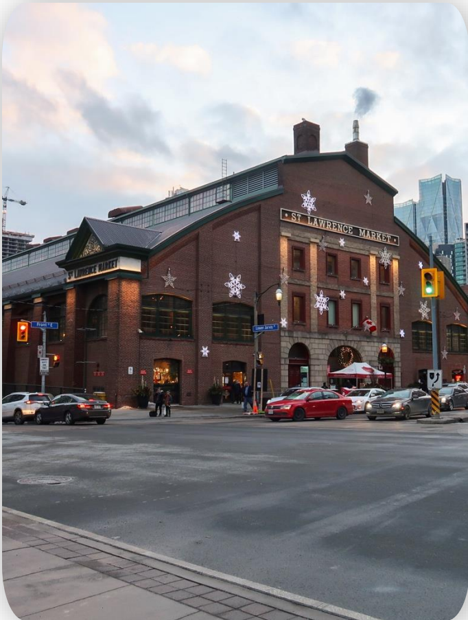
St. Lawrence Market