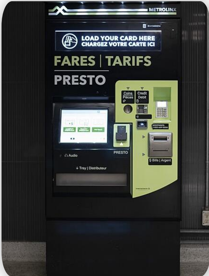
Presto Card 리더기 및 셀프 자판기