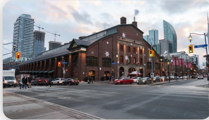
방문할 곳 토론토의 유명 명소 및 추가로 가볼만한 장소