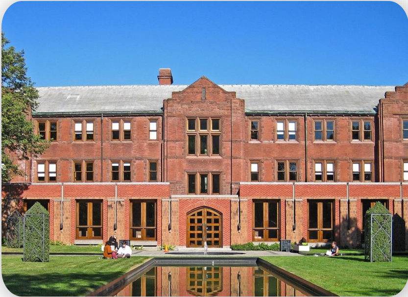
University of Toronto