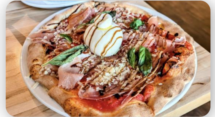
식당 점심 및 저녁식사를 위한 식당