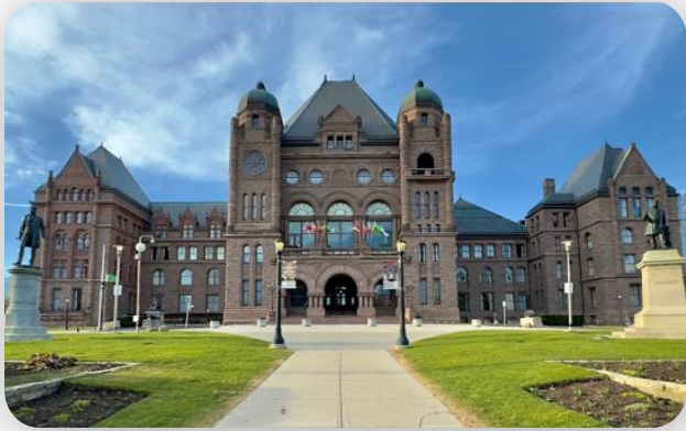
Trinity Bellwoods Park