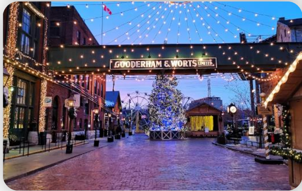
The Distillery Historic District