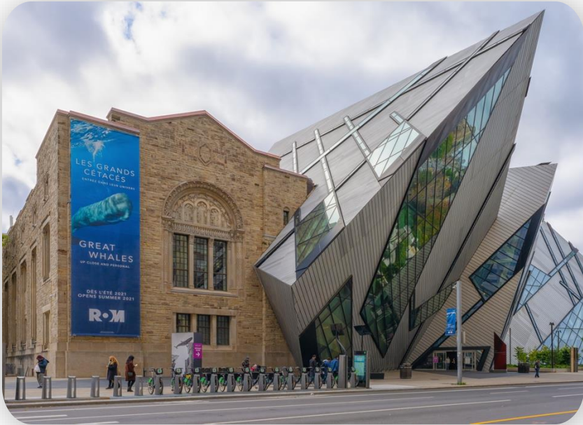
Royal Ontario Museum