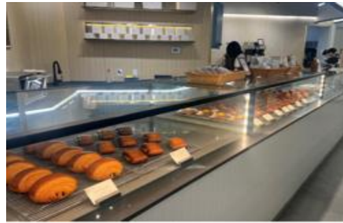
Le Genie Bakery & Espresso