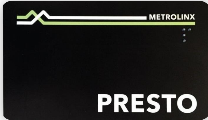
교통권 Presto card 및 Presto Day Pass Ticket